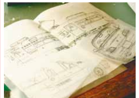
一つ一つ手で書かれた設計図