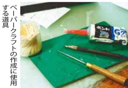
ペーパークラフトの作成に使用する道具

ペーパークラフトって何? ケント紙やボール紙など、紙を素材として作成する立体模型・立体構造物の総称。元となる建物や乗り物、風景などを参考に、設計図を計算・作成し、さまざまな紙から部品を切り抜き、重ね合わせ、立体的に組み立てる。現在では、さまざまな用途で利用・頒布されており、販売促進用のPOP広告や立体絵本などで使用されている。