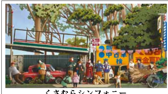
くさむらシンフォニー