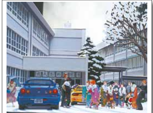
東京わが母校 晴れ着と雪化粧