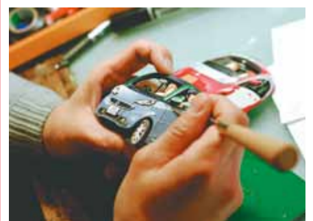
設計図を基に作り込んでいく