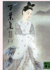
『万葉集 全訳注原文付(一)』 中西進 校注 講談社