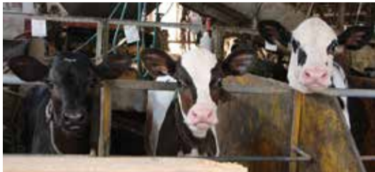
今年生まれた子牛達

清瀬市役所から市役所通りを志木街道方面に進み、トウモロコシ畑をさらに進むと左手に増田牧場が見えてきました。愛くるしい牛たちが顔をのぞかせます。