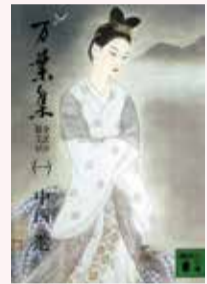
『万葉集全訳注原文付(一)』中西進/校注 講談社