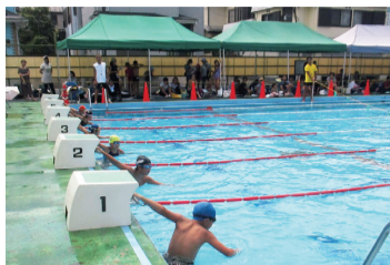
スタートを待つ選手の皆さん

8月24日、下宿市民プールで「第18回清瀬市小・中学生水泳記録会」が開催されました。熱い声援と暑い気温のなかで111人の選手が日ごろの練習の成果を惜しみなく発揮し、自分の記録に挑戦しました。この記録会で生まれた新記録は市ホームページでご確認ください。