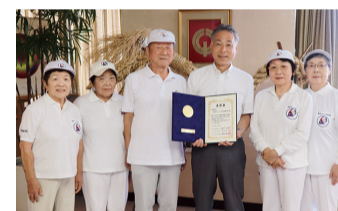
ラジオ体操連盟の皆さんと渋谷市長

7月28日、駒沢オリンピック公園総合運動場(世田谷区駒沢公園一丁目)で「1000万人ラジオ体操・みんなの体操祭」が開催され、令和元年度ラジオ体操優良団体等全国表彰を全国から選ばれた7団体のうちの1つとして、清瀬市ラジオ体操連盟が受賞しました。おめでとうございます。