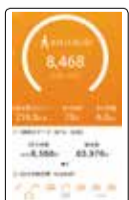
スマートフォンアプリ