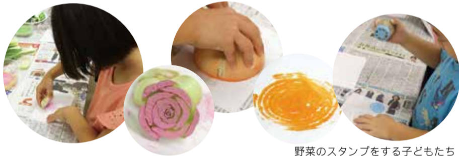
野菜のスタンプをする子どもたち

次はいよいよ、子どもたちも大好きなワークの時間です。切り方次第で、おもしろい形になる野菜たちを、紙にスタンプしていきます。