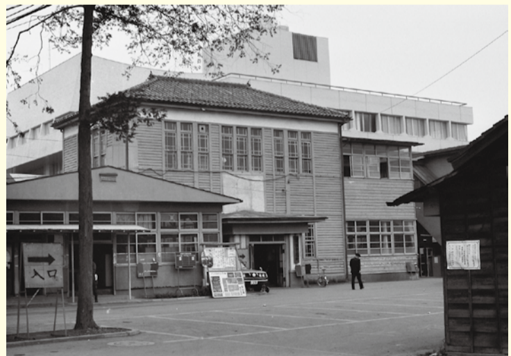
昭和の「旧庁舎」と「新庁舎」 昭和48年ごろ

そして、昭和48年にその役目を引き継いだ現庁舎は、昭和の終わりを、平成の終わりを見届け、令和の新庁舎に役目をバトンタッチすることになります。