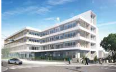
新庁舎のイメージ

30分～午後5時に所定の用紙に必要事項を記入し、直接持参(直接持参の場合は9月7日(土)・8日(日)・14日(土)を除く)または郵送で、職員課職員係☎042-497-1843へ ※市ホームページの公開は、9月1日(日)から行います。 ※提出書類など、詳しくは募集要項をご覧ください。