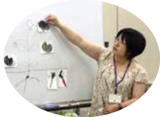
野菜の食べている部分を説明

スーパーで売っている、たくさんの種類の野菜たち。種をまき、芽が出て、花が咲き、やがて実になる植物のどこを食べているのかを、多摩六都科学館の方にわかりやすく教えていただきました。