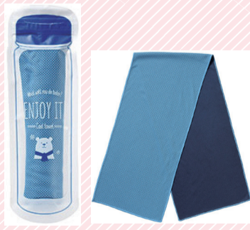
「ケース付きクールタオル」

各ブースで環境について学び・体験し、会場内「本部テント」で配布する用紙にスタンプを集めよう。15個以上集めたら、「ケース付きクールタオル」をプレゼント！景品はなくなり次第終了です。 スタンプラリー実施ブースは全26か所あります。実施団体や各ブースの場所については、当日会場で配布するチラシ裏面をご覧ください。