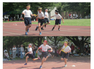
記録に挑戦する選手たち