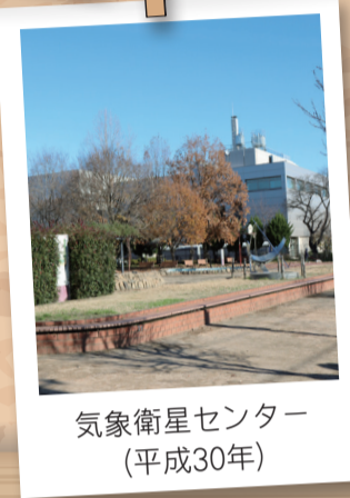
気象衛星センター (平成30年)