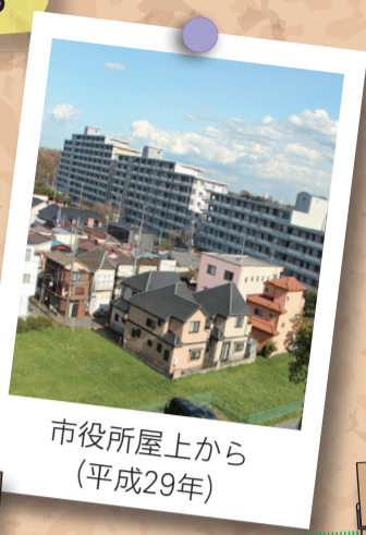
市役所屋上から (平成29年)