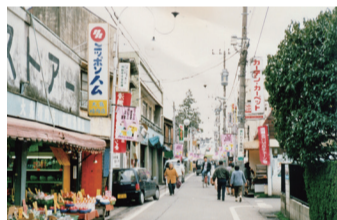
再開発前の北口の商店街