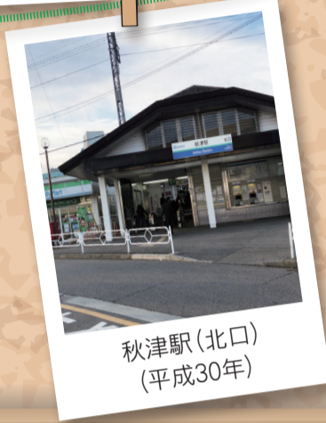
秋津駅(北口) (平成30年)

今年で平成が終わり、新しい時代が始まります。市報きよせの1月1日号4・5面では、平成30年間の出来事や清瀬市の情勢などをテーマにした、『平成の思い出すごろく』があります。