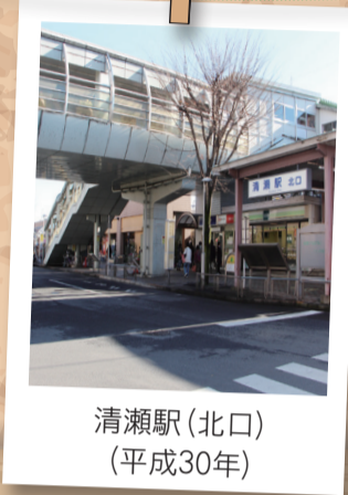
清瀬駅(北口) (平成30年)