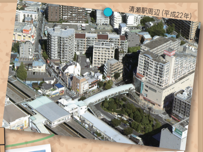
清瀬駅周辺(平成22年)