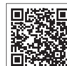
カタログポケット「市報きよせ」のページ