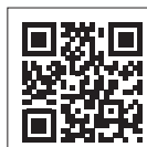
「カタログポケット」トップページ