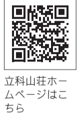
立料山荘ホームページはこちら