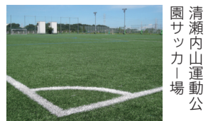
清瀬内山運動公園サッカー場