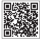
カタログポケット「市報きよせ」