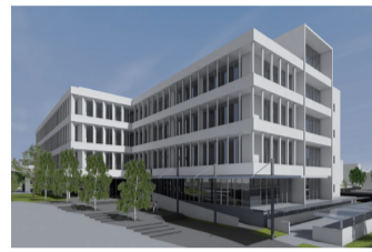
清瀬市役所新庁舎イメージ図

☎11月25日・26日 午前9時～午後5時(正午～午後1時を除く)に必要な書類を本人が直接持参し、採用試験申込み受け付け所(職員課職員係) ☎042・497・1843へ