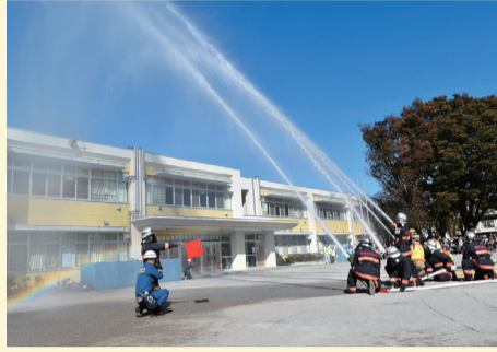
昨年の訓練の様子