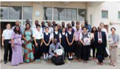
ユネスコの平和研修チームと清中生徒会役員

この平和研修チームはユネスコが企画し、広島大学教育開発国際協力研究センターが支援する平和教育プログラムの一環で、広島市の平和祈念式典に合わせて来日しました。