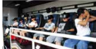
VR体験をする小学生たち

清瀬消防署の担当者は、「今後もVR防災体験車を活用するなど防火防災訓練を推進し、市民の防災意識の高揚を促進していきます。」と語りました。