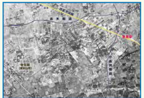
～空から見た結核療養所の姿～ 上: 統合(昭和37年)前の清瀬病院全景(『国立療養所東京病院統合15周年記念誌』より) 右: 昭和31年の病院街一帯(国土地理院提供写真に文字入れなど加工)

本編をご覧になるには 市ホームページ … トップページ > 市政情報 > 広報 > 清瀬市ブログ プリントアウト版… 市内の各図書館 でご覧いただけます