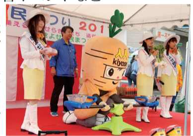
昨年の市民まつりでの活動

親善大使は、市民まつりや都内各地のイベントで清瀬市に関するPR活動を行い、市の知名度向上や農産物・商工業製品の販売促進に活躍していただき、来年のきよせ市民まつりの企画・立案にも参加していただきます。 対象 市内在住・在勤、近隣市在住の方など清瀬を愛する方で、平成30年10月1日時点で満20歳以上の方(モデルなどの専属契約がある方は除く) 任期 原則、今年度のきよせ市民まつり開催日(10月21日(日))から翌年のきよせ市民まつりの前日まで 主な活動実績 FM西東京(ラジオ)、J:COM(ケーブルテレビ)でのPR活動、清瀬市成人記念式典、清瀬消防署イベントなど 申込み・問合せ 8月31日(消印有効)までに清瀬商工会・市役所企画課で配布の応募用紙(清瀬商工会ホームページ http://www.kiyose.or.jp からダウンロード可)に必要事項を記入し、写真を貼付して、直接窓口または郵送で〒204-0022松山2-6-23 清瀬商工会「きよせ親善大使イベント事務局」☎042・491・6648へ(提出した書類、写真は返却不可)