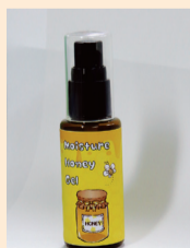
「きよはちモイスチャーハニーゲル」