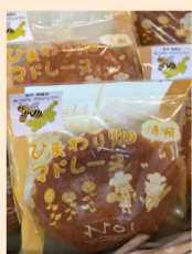
「ひまわり畑マドレーヌ」