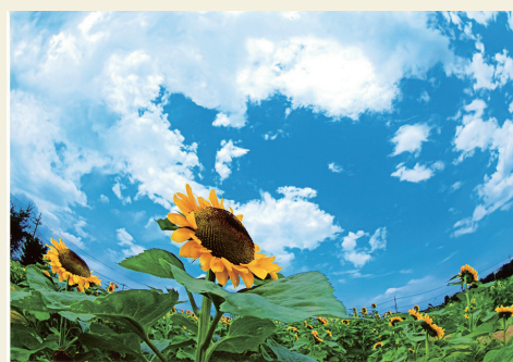
平成29年度武蔵村山フォトコンテスト最優秀賞作品