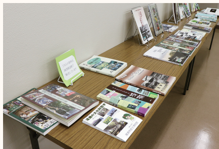
講演会場場の関連書籍紹介コーナー