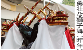
勇壮な獅子舞(昨年)