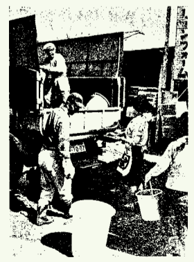
ごみ収集の様子(町報昭和40年3月15日号)

本編をご覧になるには 市ホームページ…トップページ>市政情報>広報>清瀬市ブログ プリントアウト版…市内の各図書館でご覧いただけます