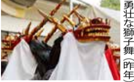
勇壮な獅子舞(昨年)