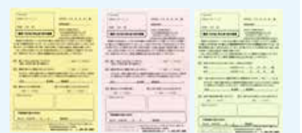
上記3色(黄色・もも色・黄緑色)の内いずれかの色のアンケートが届きます

ご注意を 市職員を装った還付金詐欺にご注意ください！「携帯電話」を持って「ATM(現金自動受け払い機)」へと言われたら還付金詐欺です！