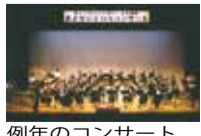
例年のコンサート

日時 7月14日(土)午後1時30分 対象 市内在住の方。先着500人 場所 清瀬市市民センター 問合せ 生活福祉課庶務係 ☎042・497・2058