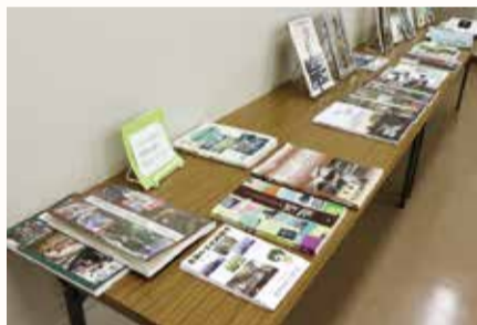
講演会場場の関連書籍紹介コーナー