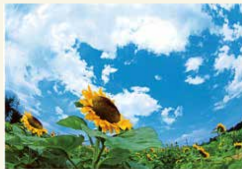
平成29年度武蔵村山フォトコンテスト最優秀賞作品