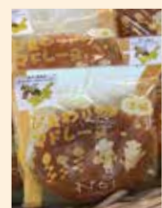
「ひまわり畑マドレーヌ」