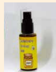
「きよはちモイスチャーハニーゲル」

清瀬市役所産はちみつKiyohachiを使った新製品の販売会を開催します。市内事業者により開発された「ひまわり畑マドレーヌ」「きよはちモイスチャーハニーゲル」を市役所正面玄関前に特設販売所を設け、4日間限定で特別価格で販売します。また、下記期間中に「低中木の蜜源植物の苗木無料配布会」と「地元園芸農家による花の直売(3日・4日のみ)」も開催します。 日時 7月3日(火)～6日(金)午前10時～午後2時 場所 市役所正面玄関前 価格 「ひまわり畑マドレーヌ」は150円(税込み)・通常は163円(税込み)、「きよはちモイスチャーハニーゲル」は800円(税込み)・通常は888円(税抜き) 販売者 スイーツガーデンノイ、株式会社ソーシン 後援 東京清瀬市みつばちプロジェクト 問合せ 総務課営繕係 ☎042・492・5111(内線524)