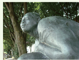
「ユカタン の女」 フランシスコ・スニガ