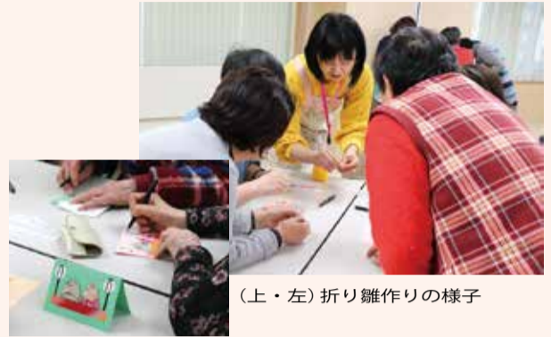
(上・左) 折り雛作りの様子

た気分転換もできる。そんな場所になるよう、これからもお手伝いしていきたいですね。私たちボランティアも、その日に活動できる人が、できることをするという無理のないスタイルで運営していますので、皆さんも気軽にお越し下さい」とニコリと笑顔で話されました。