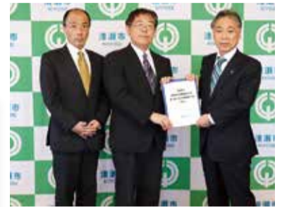
渋谷市長(右)に答申を手渡す下垣委員長(中央)と小滝副委員長(左)

この度、「清瀬市高齢者保健福祉計画・第7期介護保険事業計画(案)」の最終報告書が同策定委員会から市長に提出されましたので、その内容を報告します。 問合せ 高齢支援課介護サービス係 ☎042・497・2080、同課高齢福祉係 ☎042・497・2081、同課管理係 ☎042・497・2079