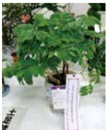
受賞したメリアンサス