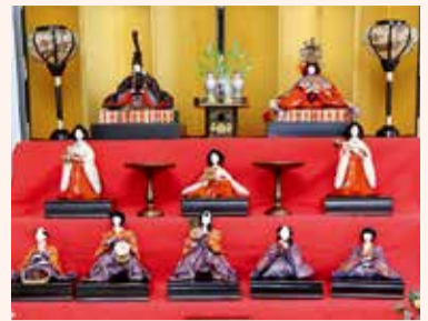
大正時代のお雛様

清瀬駅北口を出てすぐ右手に見える「アミュービル」。こちらの4階「アイレック(男女共同参画センター)」で2か月に1度(原則、偶数月の第1木曜日)のペースで、誰もがくつろげる「つながりカフェ」が開催されています。家でも職場でもない第3の場所として交流の場となっています。今回は「つながりカフェ」の取り組みをご紹介します。