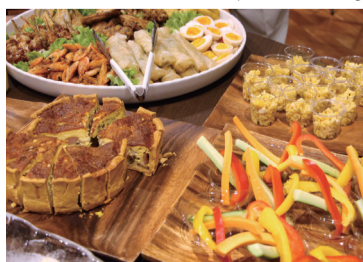
美味しい料理と楽しいゲームを 味わって楽しんでください

・11511へ(原則電話での申込みはできません) 491・9027、池乃屋珈琲(KENNOYA COFFEE) ☎042・458 協働係 ☎042・497・1803または市民活動センター ☎042・ 申込み・問合せ 2月15日～3月5日に、直接企画課市民 費用 男性6千円 女性4千円 ※詳しくは市ホームページまたは企画課市民協働係へ。 申し込み・問合せ 2月15日～3月5日に、直接企画課市民 協働係 ☎042・497・1803または市民活動センター ☎042・ 491・9027、池乃屋珈琲(KENNOYA COFFEE) ☎042・458 ・11511へ(原則電話での申込みはできません)