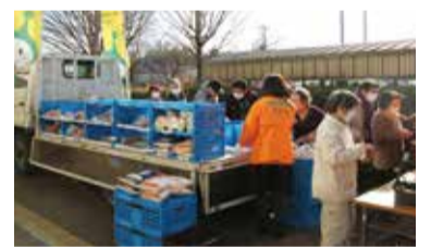
先月行われた即売会の様子

昨年12月20日、地産地消推進と地域福祉向上を図るため、JA東京みらいと清瀬直売会の協力により、中里地域市民センターにおいて市内産農産物などの移動即売会を実施しました。この即売会は、下記のとおり今後も毎週水曜日に行います。新鮮な清瀬産野菜を食卓へ、ぜひご利用ください。 販売時期 原則毎週水曜日午前10時～11時(売り切れ次第終了。天候不順などの場合及び水曜日が祝祭日の場合は開催しません) 場所 中里地域市民センター正面入口付近 問合せ 産業振興課産業振興係 ☎042・497・2052