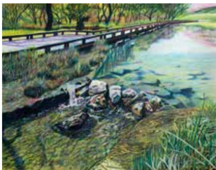
▲「春色の煌めき」清瀬市金山緑地公園(2017年) ◀「早春の道」清瀬市中里(2017年)