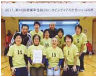
優勝した「スマイル」の皆さん

11月19日、ひたちなか市総合体育館（茨城県ひたちなか市新光町）で開催された「第40回関東甲信越ブロックインディアカ大会inいばらき」のスーパーシニア女子の部で、市内のチーム「スマイル」が優勝を果たしました。4月に行われた東京都予選を突破し、都の代表チームとして出場、今大会では1都7県8チームによるリーグ予選と決勝を見事勝ち抜きました。おめでとうございます。