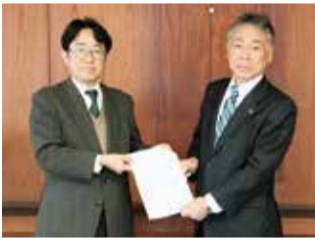
清瀬市補助金適正化検討委員会星野委員長(左)と渋谷市長(右)

12月15日、今後の補助金の適正化について、清瀬市補助金適正化検討委員会から市長に答申されました。市では、補助金の適正化に取り組むため、委員会を設置し、公募市民や学識経験者など10人の委員により、平成29年7月から12月までの全8回にわたり検討・審議を行ってきました。