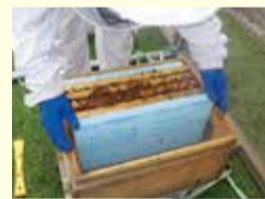
みつばちの越冬対策=(左)保温のための板を入れる(下)冷たい空気が入らないように、巣箱の入り口を狭める