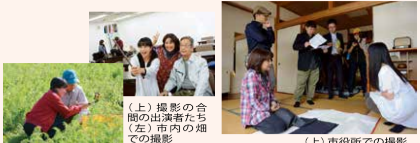
(上)撮影の合間の出演者たち (左)市内の畑での撮影 (上)市役所での撮影