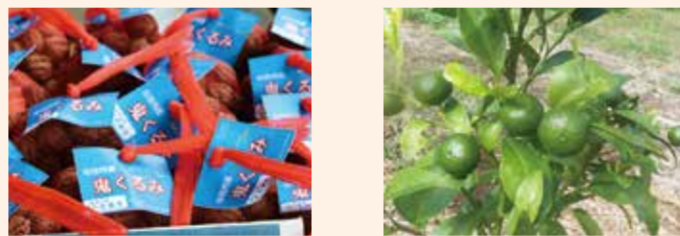
下宿の市有地に植栽されている鬼ぐるみ

市役所や小・中学校など市の土地にもさまざまな自然の恵みが育ちます。それらのなかにもそのままになってしまっているものや捨てられてしまっているものがありました。