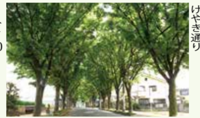
【産業廃棄物処分費の推移】

市内の木々の伐採や清掃を行うと、伐採した枝や落ち葉、道路に流出した土などの産業廃棄物が発生します。産業廃棄物の処理費用は草や葉、枝で1畧あたり約40円、道路に流出した土などは1立方畧で約18,000円ほどにもなります。これまで、多額の産業廃棄物の処理費用が発生し、その費用は年々増加の傾向にありました。管轄係が発足した当時、職員たちは考えました。