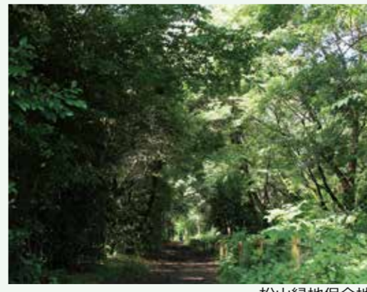
松山緑地保全地域

販売により得られた収益は、全額歳入として「緑地保全基金」に積み立てられ、市内の雑木林などの自然環境を守り、育成するための活動に充てられています。市内の自然を維持・管理するために発生した副産物を加工・販売した収益で、清瀬の自然をより豊かにすることが、清瀬のエコプロモーションの使命となっています。