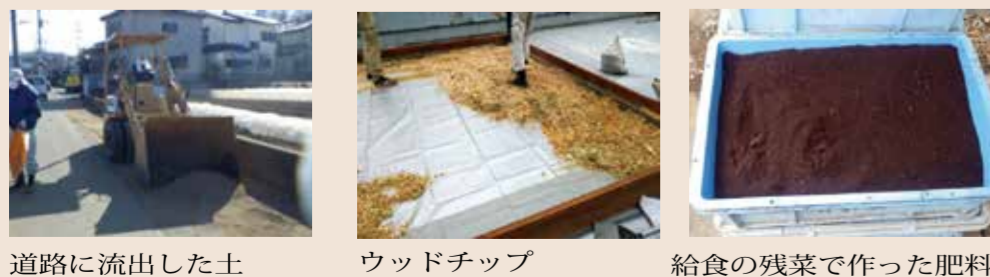
道路に流出した土 ウッドチップ 給食の残菜で作った肥料