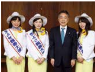
きよせ親善大使の皆さんと渋谷市長

親善大使は市長と懇談し、市長の市の歴史に関する話に熱心に耳を傾け、清瀬市のPR活動への思いを再確認していました。