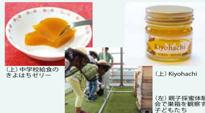
(上) 中学校給食のきよはちゼリー