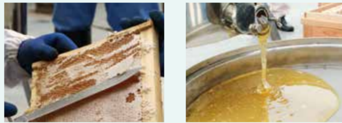
(右・左) 採蜜の様子

また、はちみつ原料となる蜜源植物の無料配布会では、市内農家と協力し野菜と花の販売会を同時開催しています。