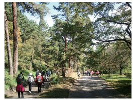
中山道ウォーキングの様子

清瀬市の「友好交流都市」である立科町の方々と交流を深め、立科町の魅力を満喫してみませんか。 そば打ち体験や、立科町内に開催される「中山道ウォーキング」に参加します。江戸時代の五街道の一つである中山道を芦田宿や笠取峠の松並木など、立科の自然を感じながら歩きます。 皇女和宮が芦田宿で食べたと言われる食材を使った特製「和宮御膳」付きです! ※当事業は企画課が交付する「立科町との交流事業補助金制度」を活用しています。 対象 市内在住の方。先着30人 日時 10月21日(土)午前7時～22日(日)午後7時ごろ 集合・解散 清瀬駅北口クレアビル前 宿泊場所 清瀬市立科山荘(長野県北佐久郡立科町大字芦田八ヶ野) 費用 おとな=11,000円・小学生=6,000円・幼児=2,500円(1泊4食、保険代など含む) 申込み・問合せ 9月4日午前9時から直接窓口または電話で生涯学習スポーツ課 ☎042・495・7001へ