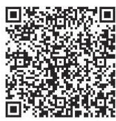
電子申請用QRコード

多摩六都の水と緑を楽しんでみませんか。 清瀬松山緑地保全地域・野火止用水歴史環境保全地域など全長約6キロを歩きます(途中、トイレ休憩・20分程度の休憩あり)。 定員100人(応募者多数の場合抽選)。参加費無料。 日時 10月7日(土)午前9時～正午(予定)、集合=清瀬駅南口・解散=東久留米駅西口(雨天決行、荒天の場合中止) 持ち物 飲み物・雨具など 申込み・問合せ 9月26日(必着)までに電子申請(下記QRコードから応募可)または往復はがきに参加希望者全員分の住所・氏名・年齢・電話番号を記入し、水と緑の環境課緑と公園係 ☎042・497・2098へ。結果及び当日の詳細は9月29日付けで申込者に送付します