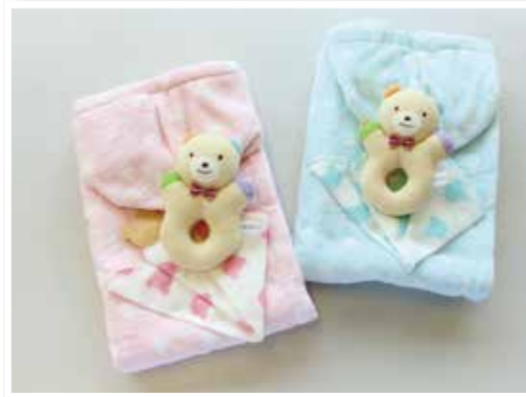
3～4か月児健康診査を受けた方には、「バスボンチョ」をプレゼント！かわいいラトルと、ガーゼハンカチも付いています。

Present! 当市の「3～4か月児健康診査」を受けた方に、グッズをお渡します！