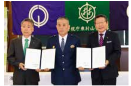
中根康太郎警視庁東村山警察署長(中央)、渡部尚東村山市長(右)と市長

5月17日、東村山市とともに、警視庁東村山警察署との間で「児童虐待の未然防止と早期発見に向けた情報共有等に関する協定」を締結しました。虐待を疑わせる通報や、居所が不明な児童などに対し、初期段階から警察と自治体が協力し、対応していくこととし、児童虐待を未然に防ぐことを目的としています。こうした協定は、26市では初めての試みとなります。