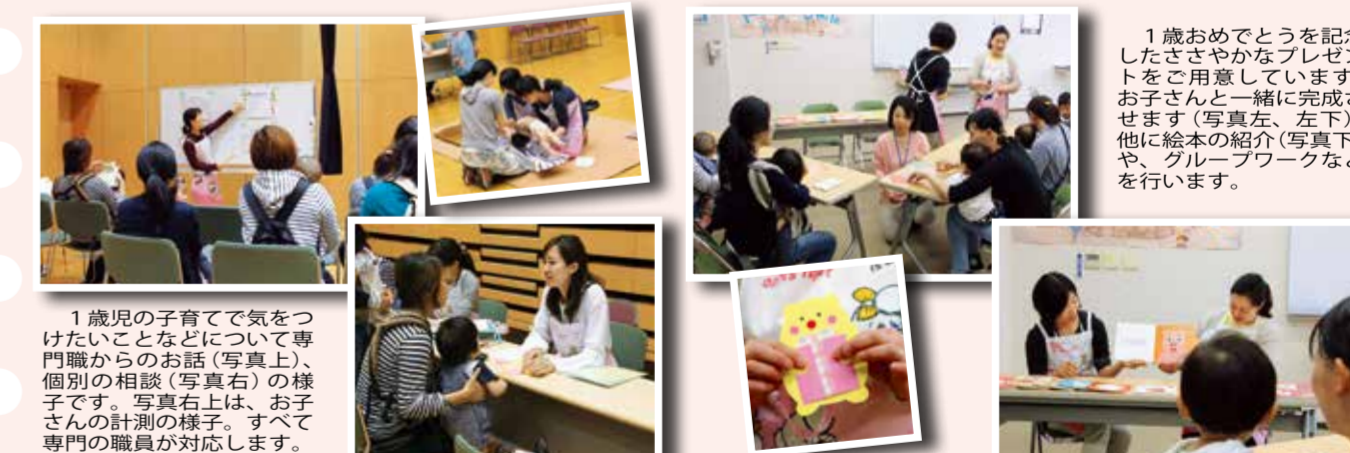
1歳児の子育てで気をつけたいことなどについて専門職からのお話(写真上)、個別の相談(写真右)の様子です。写真右上は、お子さんの計測の様子。すべて専門の職員が対応します。