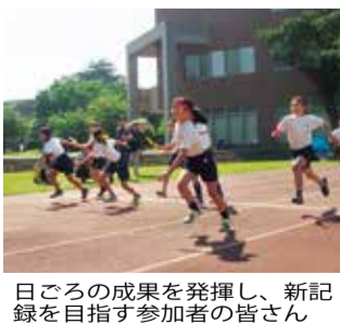
日ごろの成果を発揮し、新記録を目指す参加者の皆さん

■お詫びと訂正：市報6月1日号1面におきまして、誤りがありました。【各館の開館日・閉館日など】の野塩・下宿児童館の休館日が水曜日とありますが、正しくは「月曜日」となります。ご迷惑をおかけしましたことをお詫びし、訂正させていただきます。