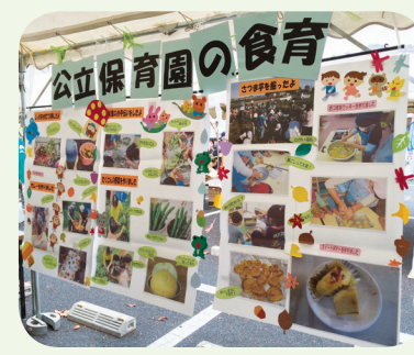
保育園の食育紹介(昨年)

日時 11月20日(日)午前9時～午後2時30分 ◆食育展示コーナー 保育園と健康推進課の食育紹介・レシピ配布・野菜クイズ・中学生農業体験の写真展示・食券販売など ◆学校給食コーナー 学校給食の試食体験・学校の食育紹介など 食券販売時間 午前9時15分～(1食350円・限定100食) 試食時間 午前11時～・午前11時45分～(各50食) メニュー(予定) みそラーメン・ジャンボぎょうざ・華風づけ・果物・牛乳 問合せ 健康推進課保健サービス係 ☎497・2077