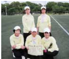
準優勝を果たした清瀬市女子チーム

5月21日、駒沢オリンピック公園総合運動場(東京都世田谷区駒沢公園)で、第69回都民体育大会のゲートボール競技が行われ、清瀬市の女子チームが準優勝を果たしました。メンバーからは「日ごろの練習成果とチームワークが発揮できました。今後も次の大会に向けて、頑張っていきたいと思っております」と喜びの声をいただきました。