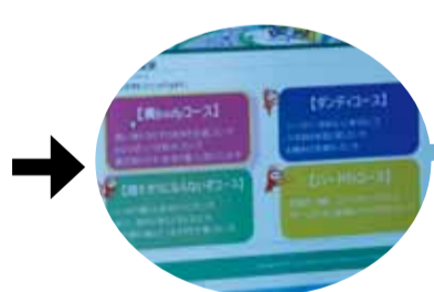
登録完了です！「美bodyコース」「ダンディコース」など、それぞれの目的に合ったコースを選択することができます。コースによって設定される目標値やメニューが変わります。