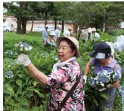
せん定作業を行うボランティアの方々

見ごろが終わったアジサイはせん定により土の養分を残すことができるため、今回のせん定作業によって、来年も美しいアジサイの開花が期待されます。