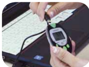
歩数計とパソコンをコードつないで「データ登録」ボタンをクリックするだけで……