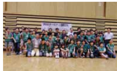
ロボットセミナー参加者の皆さん

ボクサー部門(ロボット同士を闘わせる相撲形式)とスパイダー部門(ピンポン玉を運ぶ数を競う形式)が行われ、それぞれの上位3人には11月に開催される全国大会の出場権が与えられました。(入賞者は右表参照)