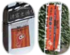
ご協力いただいている商店街などに設置されているフラッグやのぼり

「健幸ポイント」についての詳しい内容は、市報7月15日号に折り込まれたチラシをご覧ください。