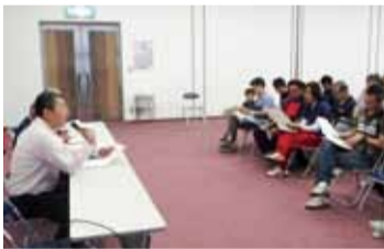
熱心に説明を聞く参加者

各チームの代表者は、講師の話す熱中症の対策から心肺蘇生法など、突発的な事態が起こった場合の対処法に熱心に耳を傾けていました。