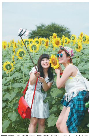
写真の部市長賞「ひまわり娘」