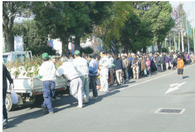
展示終了後にチャリティー配布される野菜の宝船(昨年) 大人気の「苗木の無料配布」(昨年)