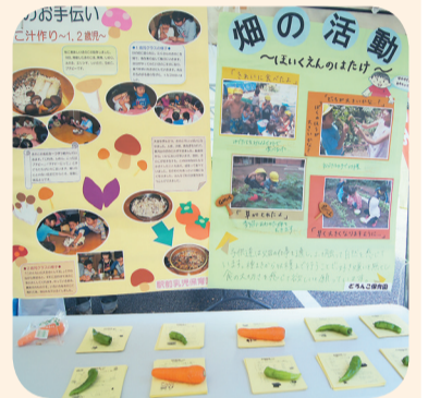
食育活動の展示(昨年)

日時 11月22日(日)午前9時～午後2時30分 場所 コミュニティプラザひまわり ◆食育展示コーナー 保育園の食育紹介・レシピの配布・中学生農業体験の写真展示・野菜の重さ当てクイズなど ◆学校給食コーナー 学校給食の試食体験・学校の食育紹介 食券販売時間 午前9時15分～(1食350円・限定100食) メニュー(予定) ごはん・魚のピリカラ焼き・磯和え・むらもスープ・ニンジンゼリー・牛乳 試食時間 午前11時～午前11時45分(各50食) 問合せ 健康推進課健康推進係 ☎ 497・2076