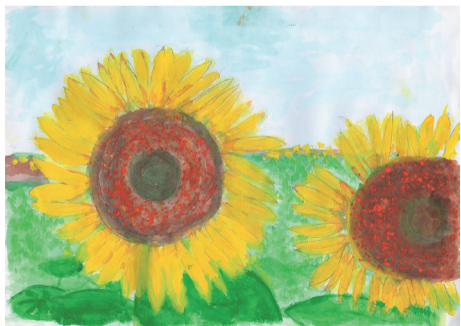
写生の部市長賞「大きなひまわり」