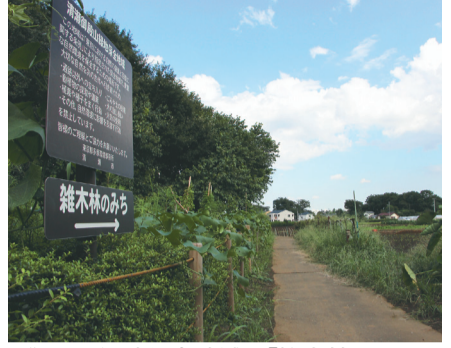
御殿山緑地保全地域の「雑木林のみち」