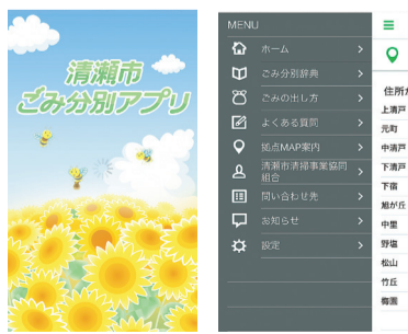
スプラッシュ画面(アプリケーション起動の際に表示される画面・左)とメニュー画面