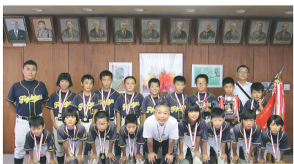
市長(中央)と野塩ファイターズの皆さん

8月21日、市内の少年野球チーム「野塩ファイターズ」が市長を表敬訪問しました。野塩ファイターズは、7月・8月に行われた清瀬市青少年問題協議会主催の夏季野球大会(小学6年生以下の部)での優勝を報告しました。