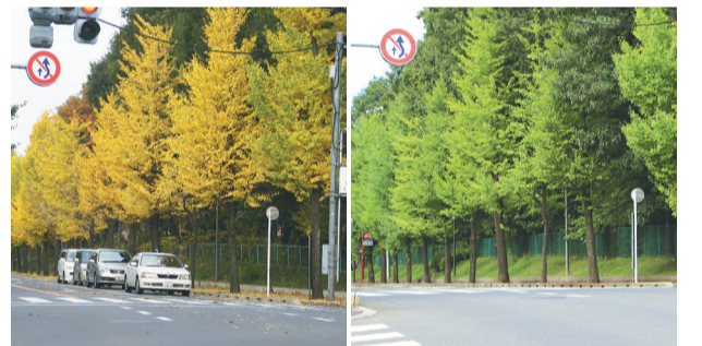
青葉が生い茂る夏のいちよう並木(右)と、紅葉が美しい秋のいちよう並木

「季節になるとあたりを黄金色に照らし、行く人の目を楽しませてくれます」と、きよせウォー