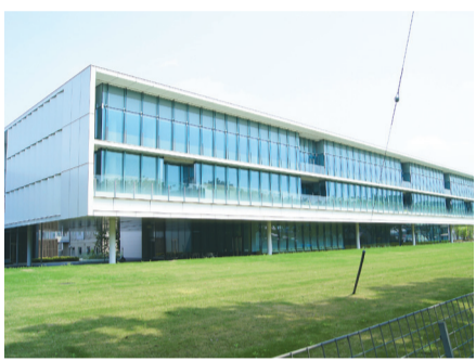
下清戸四丁目にある株式会社大林組技術研究所