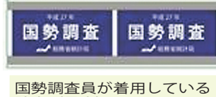
国勢調査員が着用している腕章(見本)