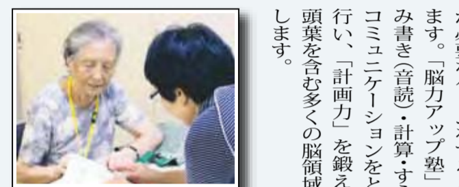
そのまま5秒キープ！