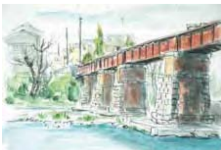
古い鉄橋(元加治駅周辺 2009年)