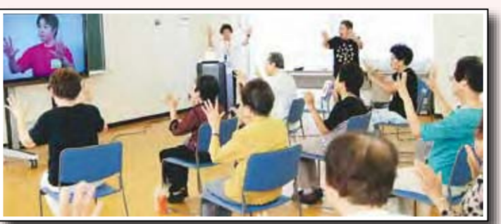
教室では、音楽に合わせて手や足のストレッチも行います

「脳トレ元気塾」では、株式会社第一興商が開発した、生活総合機能改善機器「DKエルダーステム」を活用します。「津軽海峡冬景色」など、昭和の名曲を歌いながら体を動かしたり、歌詞の一部が隠された状態で歌うなど、運動機能・口腔機能の向上や、介護・認知症予防に効果的なメニューが盛りだくさんです。