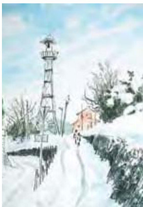
雪道を歩く(清瀬駅周辺 2014年)

作品の舞台となった清瀬市内の場所を数か所、南雲氏の説明を受けながら歩いて巡ります。先着15人。 日時 10月3日(土)午後1時30分～午後4時 ※小雨決行。荒天時は10月10日(土)に延期。 ② 野外スケッチ実践講座 南雲氏を講師に迎え、野外スケッチの基本やマナーを教えてくださいます。その後、実際に屋外に出て、風景スケッチの体験を行います。先着15人。