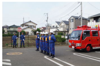
訓練の成果を披露する消防団員(左)と自衛消防訓練審査会の出場者(昨年)

消防団の操法訓練にご協力を 万が一の災害や火災などに備え、ポンプ車による操法訓練を実施しています。ご理解とご協力をお願いします。 期間・時間 9月上旬まで 午後8時～10時 場所 市内各所 問合せ 防災防犯課防災係 ☎ 497・1847