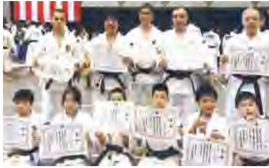
入賞を勝ち取った選手たち

7月5日、東京武道館(足立区綾瀬三丁目)で、「2015年東京都少林寺拳法大会」が開催され、1500人以上の出場拳士が集まるなか、清瀬市からは、8種目に15人が出場し、全員が入賞を果たしました。