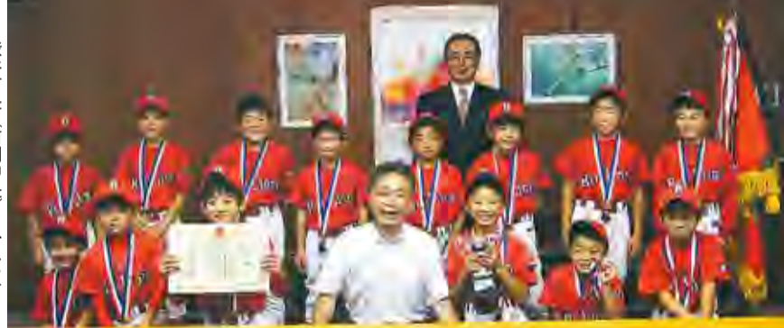
渋谷市長(前列中央)と、レッドライオンズのメンバーたち

7月8日、清瀬市で活動している野球チーム「レッドライオンズ」のメンバーが市長を訪れ、平成26年度の成績を報告しました。平成26年度は、4年生チームが前年度の春・秋の東西少年野球連盟主催の大会で優勝し、ジュニア大会でベスト4という好成績を残したことで、東西少年野球連盟から、「第18回春季東日本低学年野球大会」に推薦を受けて出場し、優勝しました。同チームは、7月11日に武蔵村山真如苑グラウンド(武蔵村山市榎一丁目)で開催された「三多摩少年野球春季大会」でも初優勝の成績を収めました。