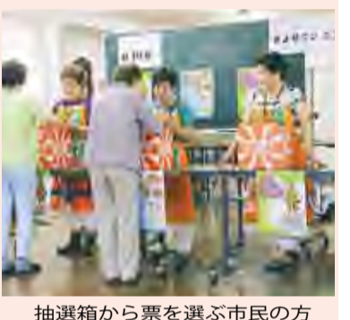
抽選箱から票を選ぶ市民の方

7月31日、清瀬商工会館(松山二丁目)で、「きよせニンニスタンプ事業第1回公開抽選会」が行われました。応募総数1万2,592件のなかから、特賞=10万円・1本、1等=5万円・2本、2等=3万円・4本、3等=1万円・218本が公正に選ばれました。※当選者には、引換証を郵送します。台紙の裏に記載されているお店で金券と交換します。問合せ 清瀬商工会 ☎ 491・6648