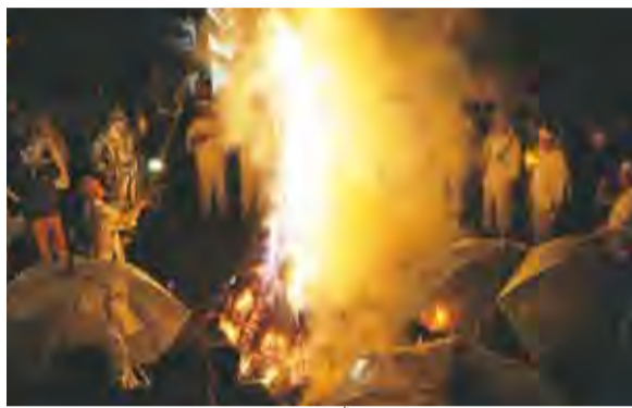
炎が間近に迫る「お焚き上げ」(昨年)

おみこし 下清戸五丁目にある八雲神社のおみこしが8月30日(日)に行われます。当日は、午後2時から7時の間に、志木街道の下清戸地区を、おとなみこしと子どもみこしが練り歩きます。子どもみこしは飛び入り参加もできます。ぜひ挑戦して、夏休みのよい思い出を作ってみてはいかがでしょうか。