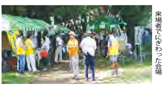
来場者でにぎわった会場

7月26日、台田運動公園及び柳瀬川河川区域で「2015きよせの環境・川まつり」が行われました。当日は多数の方が会場を訪れ、環境についての展示や、いかだコンテストなどを楽しみました。