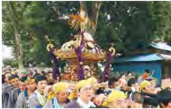
志木街道を練り歩くおみこし(昨年)