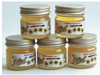
清瀬産はちみつ「きよはち」

価格 500円(80% OFF ) ※購入は1人1個のみ。 問合せ 総務課宮繕係 ☎ 497・1841