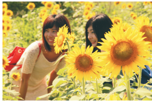
昨年度の市長賞(共演)

応募資格 アマチュアの方 応募期間 8月16日(日)から9月4日(金)まで(消印有効) 題材 フェスティバル会場のひまわり 応募作品 カラープリントの2Lサイズ(合成写真・組写真は不可) 出品数 1人1点(応募作品の返却はできません) ※写真に人物が入る場合は、本人の了承を得てください。