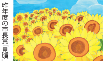
昨年度の市長賞(見頃)

応募資格 市内在住・在学の小・中学生 応募期間 8月16日(日)から9月18日(金)まで(消印有効) 題材 ひまわり 応募作品 八つ切り判(271 ミリ ×382 ミリ )以下の用紙に水彩や油彩などで描いた未発表の自作品 出品数 1人1点