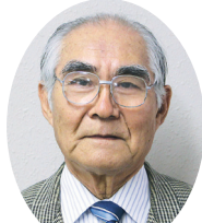
元神奈川公安調査事務所長 (法務行政事務功労)