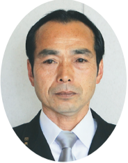
清瀬市消防団長 (消防功績)