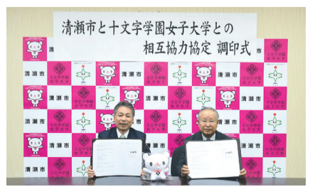
市長(左)と十文字学園女子大学の横須賀学長

4月7日、市は十文字学園女子大学・同短期大学部と相互協力協定を締結しました。今後は、清瀬市と十文字学園女子大学が相互に有する資源や人材を活用し、福祉・文化などの分野において、相互の発展を目指します。