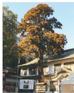
日枝神社・水天宮の樹齢400年の杉

志木街道を歩いていくと、日枝神社に行き当たったので、お参りをさせてもらうことにしました。家内や交通など、全般の安全を司る日枝神社と、安産祈願の水天宮が二つ並び、清瀬を代表する神社として折々に大勢の方々がお参りしています。