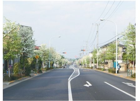
道の両側をハナミズキが彩る新小金井街道