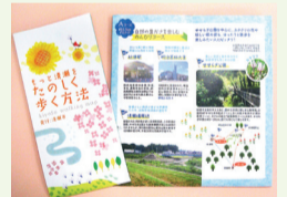
ウォーキングマップを片手に、自然を感じながら歩いてみませんか

市内各所の見どころを巡るコースをイラスト・写真で紹介している「きよせウォーキングマップ」を配布しています。ウォーキングの効果・身体にやさしいウォーキングフォームなど、情報が満載です。清瀬のまちを元気に楽しく歩きましょう。配布場所 市内各公共施設(図書館は中央・駅前図書館のみ)問合せ 健康推進課健康推進係 ☎ 497・2075