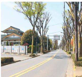
けやきの枝がせん定され、スッキリとした現在の志木街道

志木街道には、広い庭のある大きな屋敷が立ち並んでいます。梅桃、ツバキ、スイセンなど、庭を彩る数々の花は道行く人の目も楽しませてくれます。蔵のある家を見ると清瀬の歴史を感じ、時の重みを感じます。