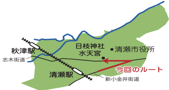
新小金井街道の大型100円ショップ付近をスタートし、志木街道を左折して日枝神社・水天宮までの道のり(約2.5km)を歩きました。

清瀬駅の北東側には、道も街並みも新しい新小金井街道がまっすぐに伸びています。街頭を白やピンクのハナミズキがおしゃれに彩り、カフェやパン屋さん、ケーキ屋さんも立ち並びます。つきあたる、古き良き清瀬を感じさせる志木街道。立派なお庭や蔵のある家を眺めながら、日枝神社・水天宮まで歩きました。