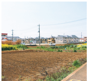
古くからある畑と新しい住宅が混在する新小金井街道沿い

いちご狩りもできるいちご園のあたりから、新住宅街だけでなく田畑も広がりを見せます。清瀬のシンボルともいえる気象衛星セン