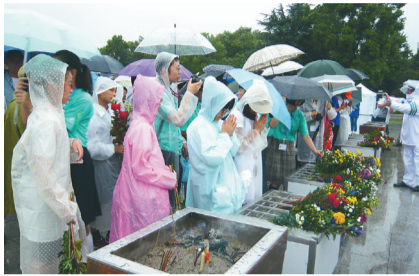
慰霊碑に献花をするピース・エンジェルズ（昨年）

対象 市内在住の小学5年生～中学生で、事前学習会・広島平和学習・事後の報告会に参加でき、過去にこの事業に参加したことのない方（保護者の同意が必要）。定員10人 広島平和学習 8月5日(水)～7日(金) 申込み 6月1日(必着)までに「ピース・エンジェルズ