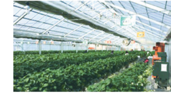
イチゴ狩りを行っているパイプハウス

市内の農業は、都内の重要な農産物生産地域として新鮮な農産物を供給しています。また近年では、地産地消の推進として、共同直売所や庭先直売での販売も増加している他、イチゴの摘み取りを行っている農家もあります。