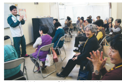
脳力アップ塾での軽体操

平成26年度に実施し、好評だった「脳力アップ塾」を、1コースから3コースに拡充します。