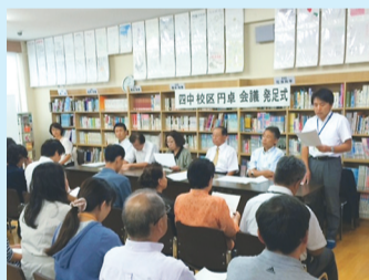
9月15日に行われた「四中校区円卓会議発足式」

域の大きな力になってほしいと考えています。地域コミュニティーに興味のある方、「地域の課題を解決し、地域をもっとよくしたい」とお考えの方など、ぜひとも円卓会議にお越しください。