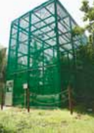
オオムラサキのケージ

台田の杜に設置されているオオムラサキのケージを一般公開します。飼育状況がご覧になれます。 日時 ①6月18日(水)〜7月16日(水)までの毎週水曜日、午後2時〜4時②6月28日(土)・29日(日)午後1時〜4時(いずれも雨天中止) 場所 伊藤記念公園 台田の杜 ※10人以上の団体による見学については、この期間内であれば、水曜日以外(平日のみ)も公開しますので左記へご相談ください。 ※台田の杜広場を臨時駐車場として開放します。 問合せ 水と緑の環境課