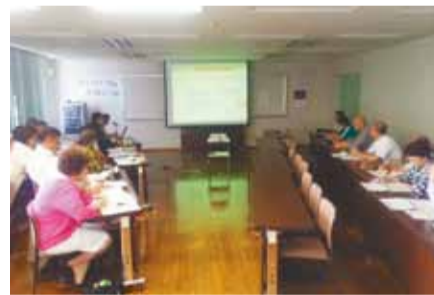
委員と市民の方による活発な意見交換

5月25日、生涯学習センターで「第11回まちづくりフォーラム」が開催されました。当日は平成25年度の活動報告及び市のまちづくりについて意見交換を行い、ご参加いただいた市民の皆さんから市民提案の回答や市長提言などについての質問や意見をいただきました。