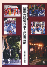
「清瀬の民俗行事と民俗芸能」