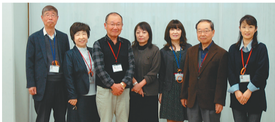
「地域の皆さんと行政とのかけ橋」として活動している民生・児童委員の方々

少子高齢化や核家族化が進むなか、安全・安心なまちづくりを進めていくには誰もが身近で気軽に相談できる環境が必要です。そのため、厚生労働大臣から委嘱された「民生・児童委員」が、住民の立場に立った支援者として活動しています。