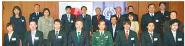
渋谷市長（前列左から4番目）と入隊される皆さんやそのご家族の方など

3月10日、市役所で自衛隊の「清瀬市入隊激励会」が行われました。4月から自衛隊に入隊する学生など6人は、市長などから励ましの言葉をもらい、「時には厳しい訓練もあると思うけど、自衛隊に入隊して自衛官を目指して頑張ります」と、入隊の決意を新たにしました。