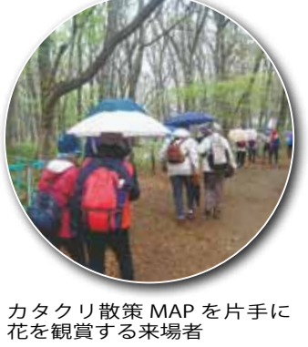
カタクリ散策MAPを片手に花を鑑賞する来場者