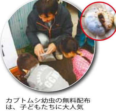
カブトムシ幼虫の無料配布は、子どもたちに大人気

緑地保全基金の募金にご協力を 清瀬の自然を守るため、清瀬市緑地保全基金協働団体の皆さまが本部に募金箱を設置し、緑地保全基金への募金活動を行います。ご協力をお願いします。 日時 3月29日(土)～4月6日(日)午前10時～午後4時 場所 第四小学校及びせせらぎ公園管理棟