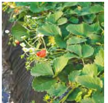
収穫の時期を迎えるいちご

家庭で育てる場合のコツを伺ったところ、ランナーで2本くらい育てるのが適当で、ポイントは「毎日の水と肥料」と「温度を10度以下にしないよう温かいところで育てること」の2つだそうです。