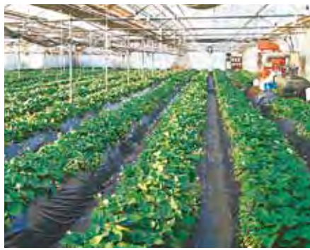
手探りで始まったいちごの施設園芸

清瀬市といえば、出荷量がダントツ1位で、東京都全体の40%以上を占める「ニンジン」のイメージが強くありますが、「いちご」も栽培されていることをご存じですか。新小金井街道の途中に「いちご」と書かれたのぼりと連なるビニールハウス。足を止めて、その前にある直売所をのぞいてみると、ありました！ 大きく、真っ赤に熟したいちごのパックが、並べられています。