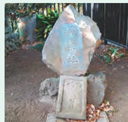
天満宮(円通寺脇)の境内に移設された「清水神社」と書かれた石

「昔、清瀬の下宿に住んでいた働き者の農民が、ある暑い日に、2本の杉の木の下にあった泉の水を飲んだところ、お酒の味がしました。それから毎日、仕事を終わると泉の水を飲み、ほろ酔い気分で帰るようになりました。不思議に思った息子が、ある日、後を付いていくと、父が泉の水を飲んで酔って行くのです。父が帰った後、息子も飲んでみましたが、ただの水でした。それ以来、『親はきき酒、子は清水』と人々は言い、その