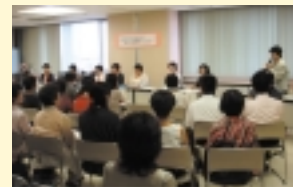
女性議員を招いて