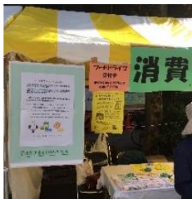
外テント・寄付食品・入り口

また、消費生活センターを知っていただくため、市民まつりにいらした沿道を歩く市民の皆さまに、講座のチラシ、啓発グッズなどを配布し、当日は消費生活相談も実施しました。