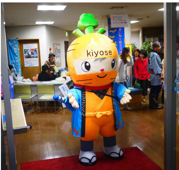
消費生活展にニンニンくんが来てくれました。