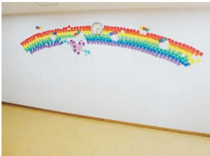
装飾もあり明るい雰囲気です。