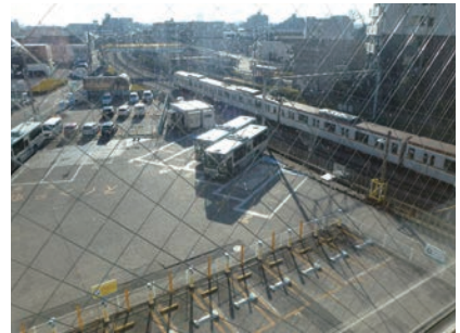
窓から電車が見える風景は子どもに人気。

(定員20名。空き状況は、アイレックの電話042-495-7002にお問い合わせください。)