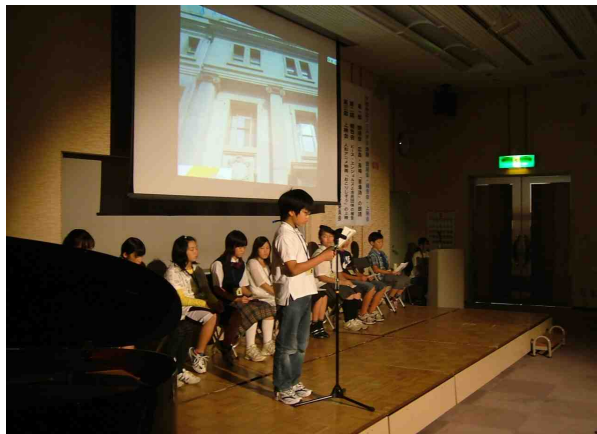
ピース・エンジェルス報告会