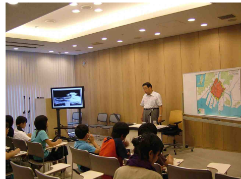
被爆された方によるお話

国立広島原爆死没者追悼平和祈念館見学の後、当時実際に被爆された方のお話を伺いました。やさしく、そしてきびしく平和の大切さと戦争の悲惨さをお話しいただきました。