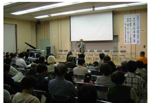
平和祈念フェスタ in 清瀬