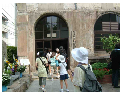
旧日本川国民学校

とても頑丈な建物だったので、爆心地の近くでも建設当時のまま残っていました。地下の金庫室や全世界から届いた千羽鶴の保管室を見学しました。