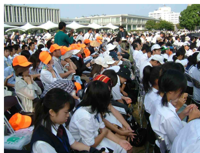
平和記念式典への参列