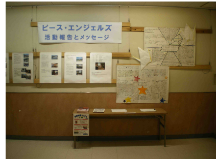
ピース・メッセージの展示

また、活動報告と感想文も展示され、来場した 2000 人を超えるみなさんに平和の大切さを伝えることができました。