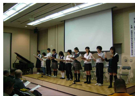
19年度ピース・エンジェルズの朗読